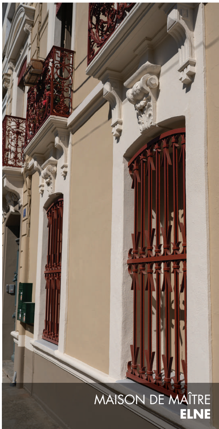
MAISON DE MAÎTRE ELNE